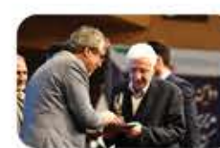
مراسم اهدای تندیس و لوح یادبود "دومین اجلاس ملی مدیریت و کارآفرینی" به سخنرانان و برگزارندگان مدیران و کارآفرینان کشور در ارزیابی اجلاس