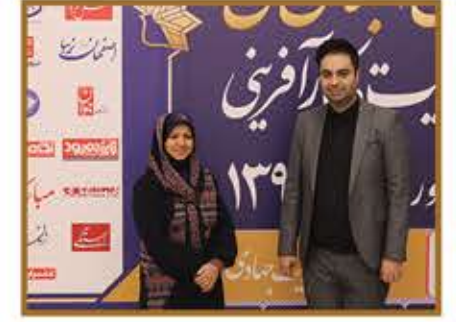
سرکار خانم دکتر فریده روشن رییس محترم کمیسیون فرهنگی شورای شهر اصفهان