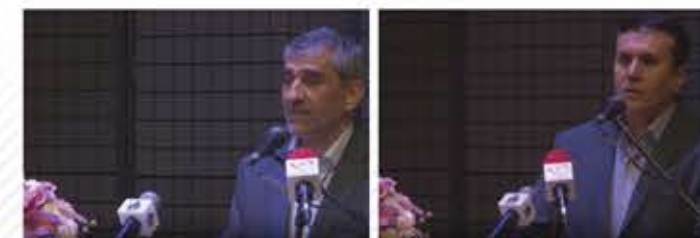
جناب آقای دکتر قاسمی معاون محترم سیاسی، امنیتی و اجتماعی استانداری اصفهان