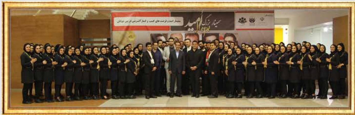
ستاد اجرایی هولدینگ پارس پندار نهاد به همراه مهمان‌های سمینار، بعد از برگزاری موفقیت آمیز سمینار بزرگ امید