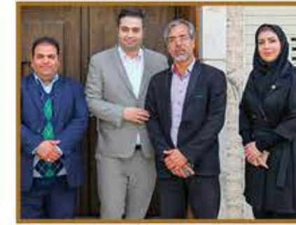
جناب آقای دکتر محمدی عضو شورای شهر اصفهان مشاور محترم وزیر کار، تعاون و رفاه اجتماعی