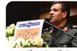
جناب آقای سردار محمد گرامی، فرمانده محترم گروه چهل مهندس صاحب (زمان/بج) نیروی زمینی سپاه پاسداران انقلاب اسلامی