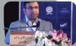
جناب آقای دکتر هاشمی : عضو کمیته تخصصی فماین مجسم تشخیص معاملات نظام کشور