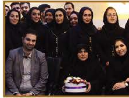
سرکار خانم دکتر شیرین طفیانی رییس محترم کمیسیون عمران، معماری و شهرسازی شورای اسلامی شهر اصفهان