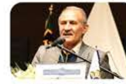
جناب آقای مهندس علی اکبری، نماینده محترم مردم شیراز در مجلس شورای اسلامی