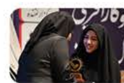
مراسم اهدای تندیس و لوح یادبود "دومین اجلاس ملی مدیریت و کارآفرینی" به سخنرانان و برگزارندگان مدیران و کارآفرینان کشور در ارزیابی اجلاس