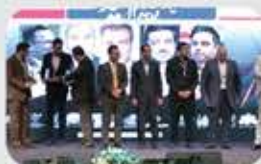
مراسم تجلیل از سخنرانان و برگزارندگان اجلاس : عزیزانی که ترویج دهنده امید در جامعه بودند.