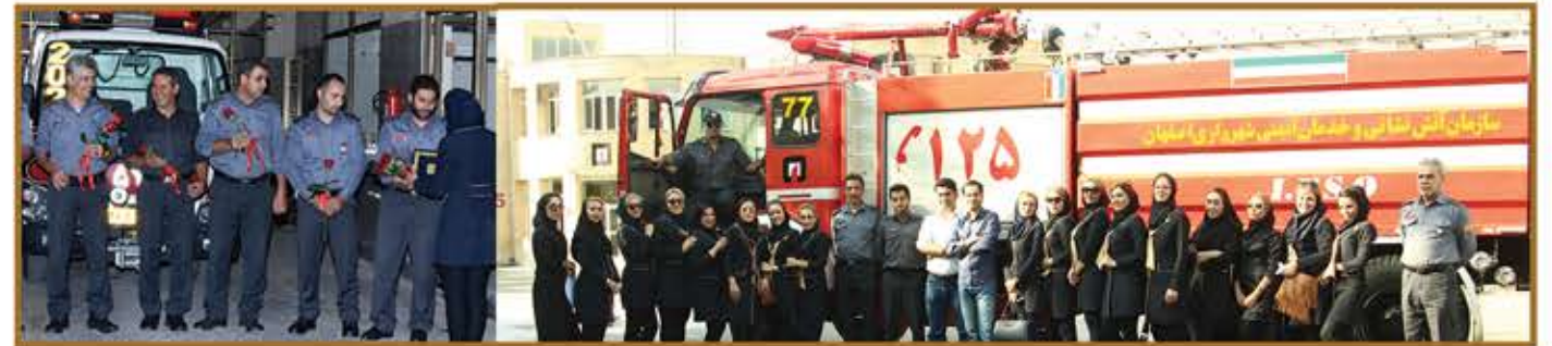
تیم هولدینگ پارس پندار نهاد، قدردانی از آتش نشانان اصفهان در روز ملی آتش نشان