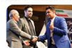
مراسم اهدای تندیس و لوح یادبود "دومین اجلاس ملی مدیریت و کارآفرینی" به سخنرانان و برگزارندگان مدیران و کارآفرینان کشور در ارزیابی اجلاس