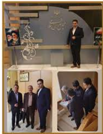
حضور در مجلس شورای اسلامی کشور