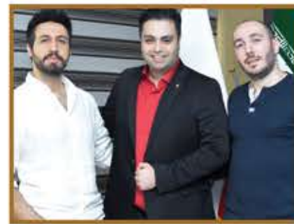
جناب آقای رستاک حلاج خواننده پاپ کشور در هولدینگ پارس پندار نهاد