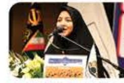
سرکارخانم دکتر زهرا سعیدی، نماینده محترم مردم مبارکه در مجلس شورای اسلامی