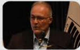
جناب آقای دکتر سید حسن قاضی مسگر سرپرست محترم معاونت هماهنگی امور اقتصادی و توسعه منابع استانداری اصفهان