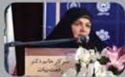
سرکار خانم دکتر زینب : نماینده محترم حوزه انتخابیه زنجان و ظرم در هفتمین دوره مجلس شورای اسلامی