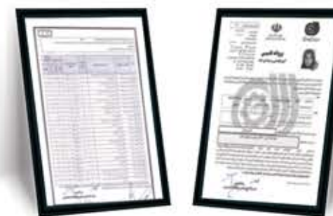
دارای مجوز از سازمان فنی و حرفه‌ای استان تهران

آموزشگاه فنی و حرفه‌ای آزاد پارس پندار با مجوز از سازمان فنی و حرفه‌ای استان تهران با گسترش خدمات حرفه‌آموزی و توسعه مهارت پذیران در رشته‌های گیاهان دارویی و بهداشت و ایمنی با بهترین مباحث آموزشی و به روزترین آن‌ها فعالیت می‌کند. آنچه پارس را از دیگران جدا می‌کند، متعهد بودن به خدمت‌رسانی در کمترین زمان ممکن، برترین اساتید و ارائه‌ی بهترین خدمات است.