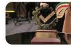
رومانی از تندیس مخصوص دومین اجلاس مدیریت و کارآفرینی توسط مهمان‌های ویژه این اجلاس