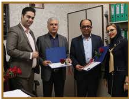
تیم هولدینگ پارس پندار نهاد در جمع پزشکان اصفهان در روز ملی بزرگداشت مقام پزشک