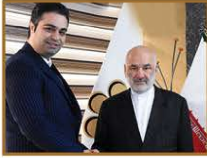
جناب آقای دکتر حسن کامران نماینده محترم مردم شریف شهر اصفهان در مجلس شورای اسلامی