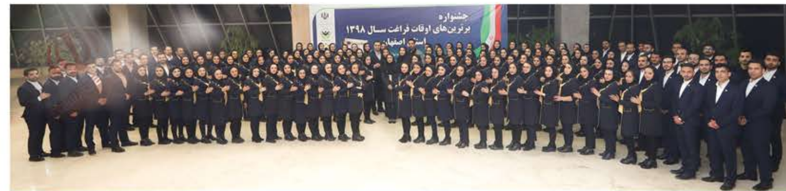
تیم هولدینگ پارس پندار نهاد در سال ۱۳۹۸ Pars Pendar Nahad Holding Team in 2019