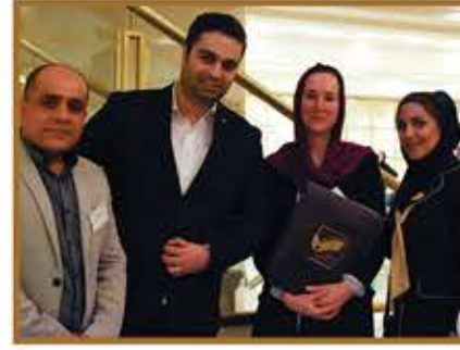
اتاق بازرگانی و صنعت، معدن و تجارت در معیت مهمانان محترم از سمت دولت آلمان