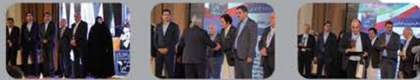
مراسم اهدای تقدیرنامه و تندیس اولین اجلاس ملی چهره‌های ماندگار کارآفرینی و مدیریت کشور در سال ۱۳۹۶