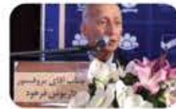
جناب آقای پروفسور داریوش فرهود : پدر علم ژنتیک ایران