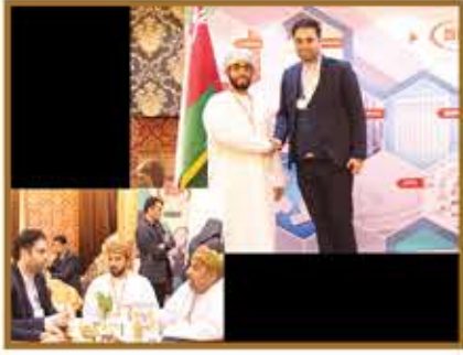
جلسه گفتگو با سفیر محترم و بازرگانان کشور عمان جهت سرمایه گذاری در ایران